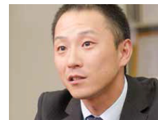
木曾、松本、塩尻 地区担当

サッカー選手の中山雅史選手(通称ゴン中山)が引退 会見をした時に最後に「こんなへたくそな選手をいまま までサポートして頂き有難うございました。」と言っていた のが印章に残っています。魂のストライカーとよばれて 気持ちでサッカーをしていたところに憧れます。気持ち でなんとかできる時代でもないですが私も魂のサービ スマンと呼ばれるぐらい頑張っていきたいと思います。