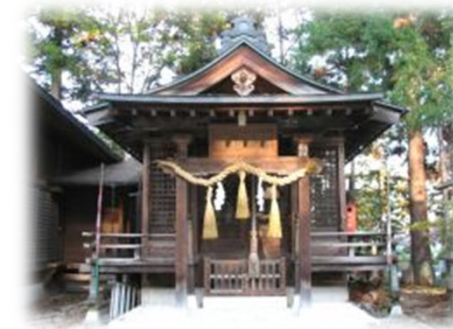
別宮・仁科天満宮

社頭案内板には、御祭神は軻遇突智命、奥津彦命、奥津姫命とし、鎌倉時代後期、仁科氏が天正寺の地に居城を構えた時、その北東(鬼門)の方向に創祀され、荒神様と呼ばれ親しまれてきた三宝荒神社である。仁科氏滅亡後は北原町住民によって護られ、明治になって王子神社と共に大町の産土神とされる。明治の始めに竈神社と改称した。例祭に催される奉納相撲は由緒深く、安政年間において相撲土俵免許状を有するは信濃国内では当社と更埴八幡の武水分神社のみとされ、現在も奉納花火と共に例祭神事として盛大に催されていると記されています。