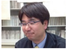
佐久、軽井沢地区担当